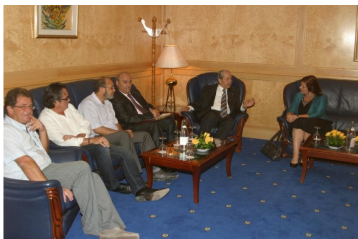
De Heer Minister in discussie met Mevr. Ambassadeur