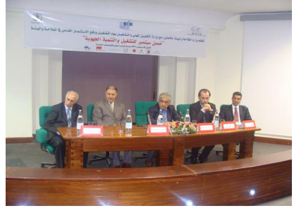
Clôture de la journée en présence de quatre Ministres Et de Mr A. Ghedira DG de l'APIA

Notre Chambre a été représentée par son Secrétaire Général. (Documents disponibles au Secrétariat de notre Chambre)