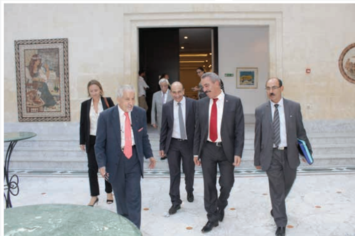
Vers la Salle «Kairouan», discussions visiblement déjà entamées...