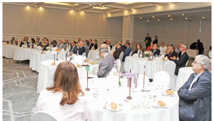
Salle bien remplie, nombreux convives