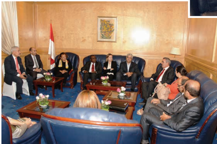
Nos invités à la salle « El Majles » très attentifs à Mr le Ministre